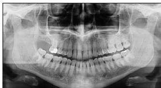
I-Max Touch 2D